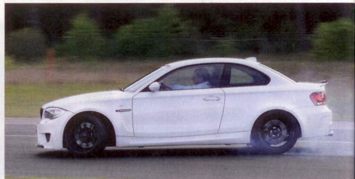
Ein bisschen Spaß muss sein: Die Tuner bewegen ihre Boliden artgerecht. Für BMW-Tuner heißt das zumeist im Drift, wie hier Günter Beckers im 1er M