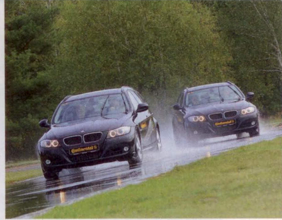
Auf dem kurvenreichen Nasshandling-Parcours konnten die Teilnehmer auf BMW 3er Touring selbst die Unterschiede zwischen Billigreifen und den Conti-Produkten erfahren