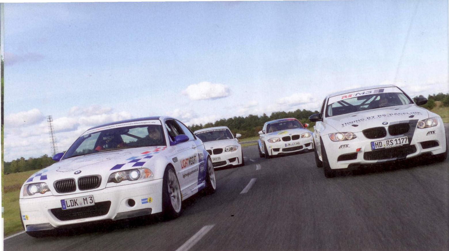
Mehr BMW-Power geht nicht! Der M3 CSL von Lightweight und der Rennsport-M3 von RS Race Line werden von zwei potenten 1er M verfolgt