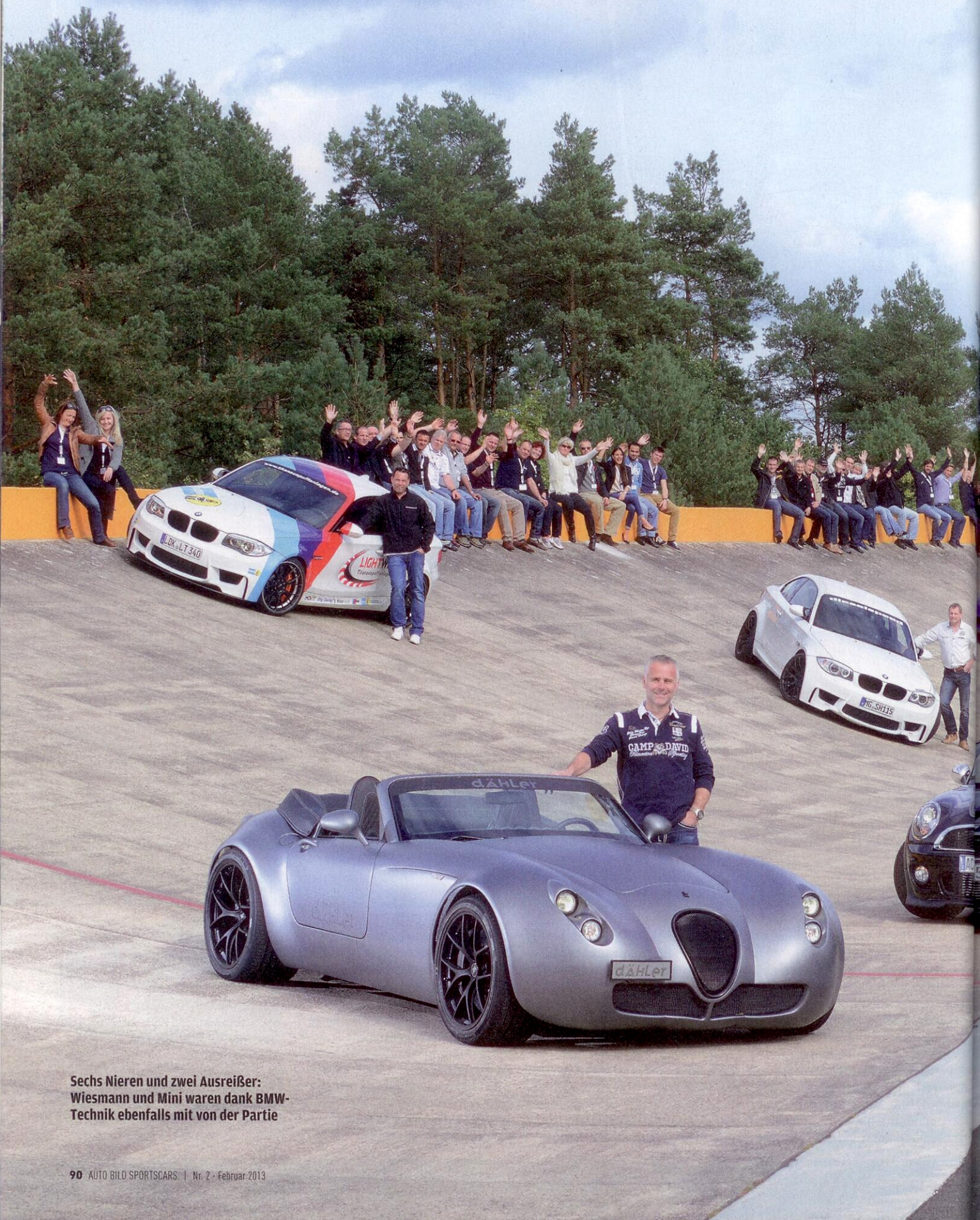
Sechs Nieren und zwei Ausreißer: Wiesmann und Mini waren dank BMW- Technik ebenfalls mit von der Partie