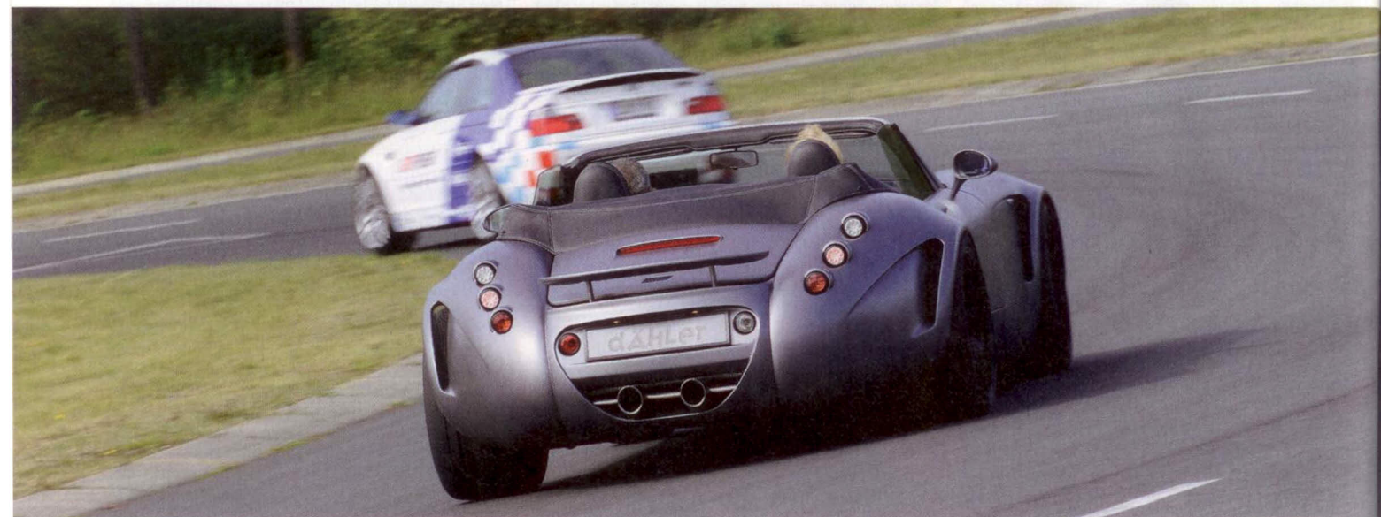
Begehrtes Taxi: Wenn man die Teilnehmer am Ende des Tages nach dem Highlight fragte, kam oft „Die Mitfahrt im Wiesmann“ als Antwort