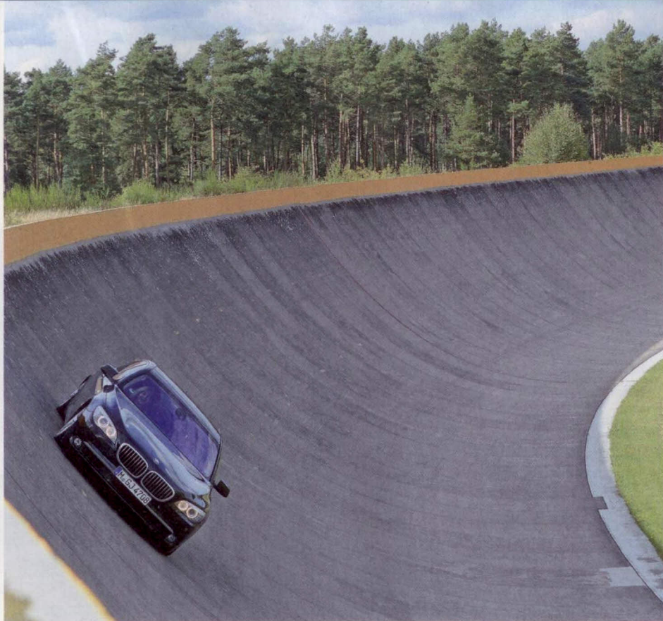
Achterbahn-Feeling und jubelnde Mitfahrer auf der Fahrt mit dem BMW 7er durch die Steilkurven

ler Freude nach dem Ritt mit dem Dähler-Donnerbolzen.