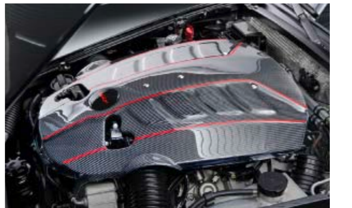
Karbon-Abdeckung aus Belp für den Edellook.