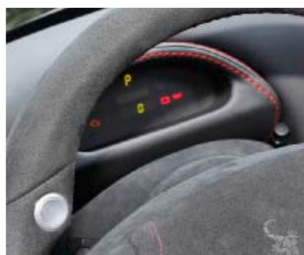
Wichtigstes digital direkt im Blick.