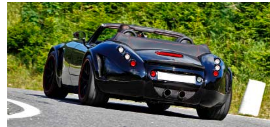
Lebhafte Wendigkeit verhilft zu grossem, gut beherrschbarem Fahrspass.