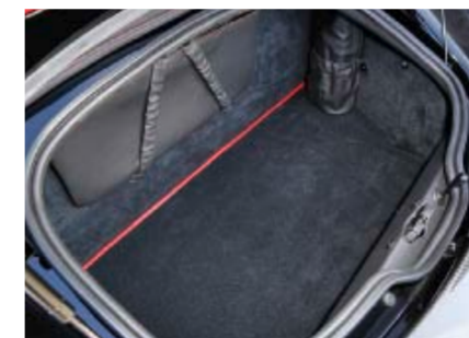
Voll ausgekleideter Kofferraum, mit spezieller Windschotthalterung.