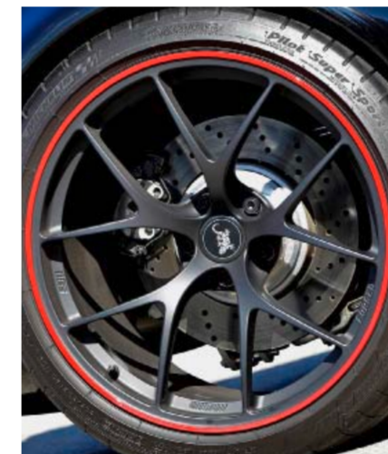
Standhafte 1-Kolben-Serienbremse im geschmiedeten 20-Zoll-Rad.