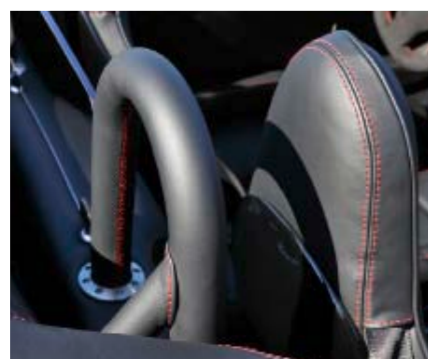
Schöne Überrollbügel, aber Option.