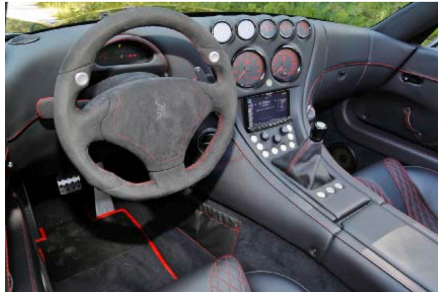
Der edel ausgekleidete Arbeitsplatz ist hochwertig verarbeitet.

Die Preise sind zuletzt zwar deutlich gesunken, doch bleiben Wagen der Marke mit dem Gecko im Emblem ein rares Gut. Und für einen Supersportwagen, der edel verarbeitet und trotz hoher Leistungsfähigkeit passablen Alltagsnutzen bietet, findet sich immer ein Käufer. Die aktuellen finanziellen Schwierigkeiten Wiesmanns schreckt Importeur Dähler nicht. Im Gegenteil. Sie hätten die Weichen gestellt für einen Weg mit den richtigen Produkten und der passenden Verkaufsstrategie. Damit der Gecko weiter um die Kurven wieselt.