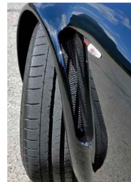
Sauber gearbeitete Details geben der Optik den richtigen Kick.

gelingen, wie wir meinen, denn der Wagen bietet zwar die erwartete sportliche Straffheit, verzichtet aber auf unnötige Härte, bügelt normale Bodenwellen statt über sie zu hoppeln.