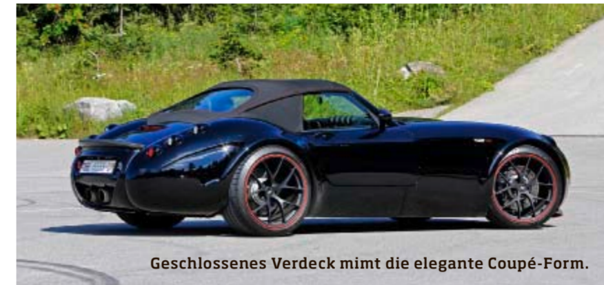
Geschlossenes Verdeck mimt die elegante Coupé-Form.

Für den Wiesmann MF5 bietet Dähler drei homologierte Leistungssteigerungssätze zum V8-Biturbomotor. Und ein Fahrwerk, das es in sich hat. Ein Ritt auf der «Basis»-Stufe,