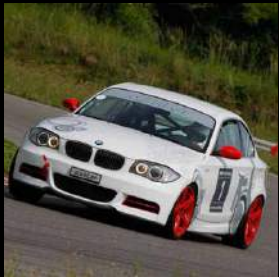
«dÄHLer race line» 03