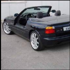
«dÄHLer classic line» 02