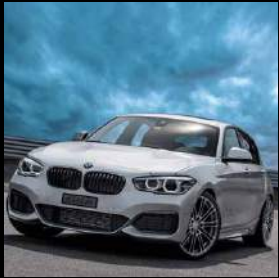
«dÄHLer competition line» 01