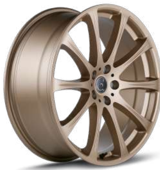
BRONZE HELL MATT BHM

Neben den aktuellen Standardausführungen liefern wir auf Anfrage auch weitere Sonderanfertigungen und die Lackierung in ihrer Wunschfarbe . Fragen Sie uns und wir unterbreiten Ihnen gerne ein individuelles Angebot!