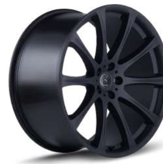
SCHWARZ MATT SM