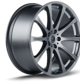
PERLGRAU GLANZ PGG