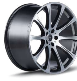
EDITION GRAU GLANZ EGG