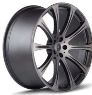
FORGED EDITION DUNKEL EGJ