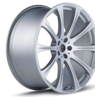
FORGED SILBER MATT SIM