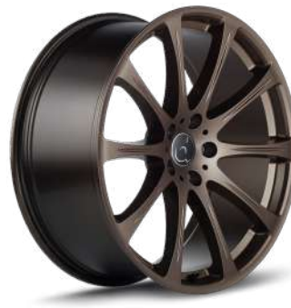
BRONZE DUNKEL MATT BDM