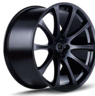
SCHWARZ GLANZ SG